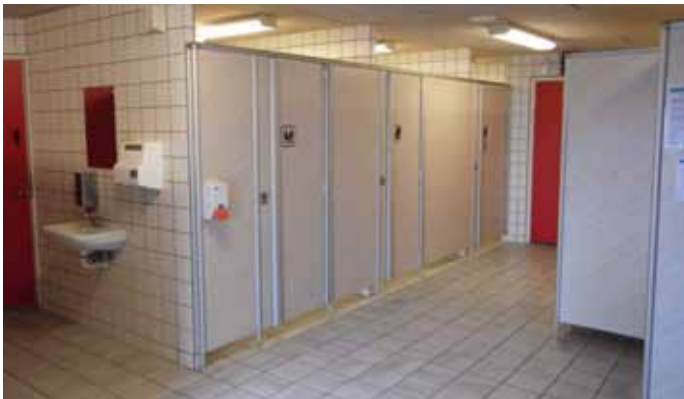
1 stk. fri håndvask